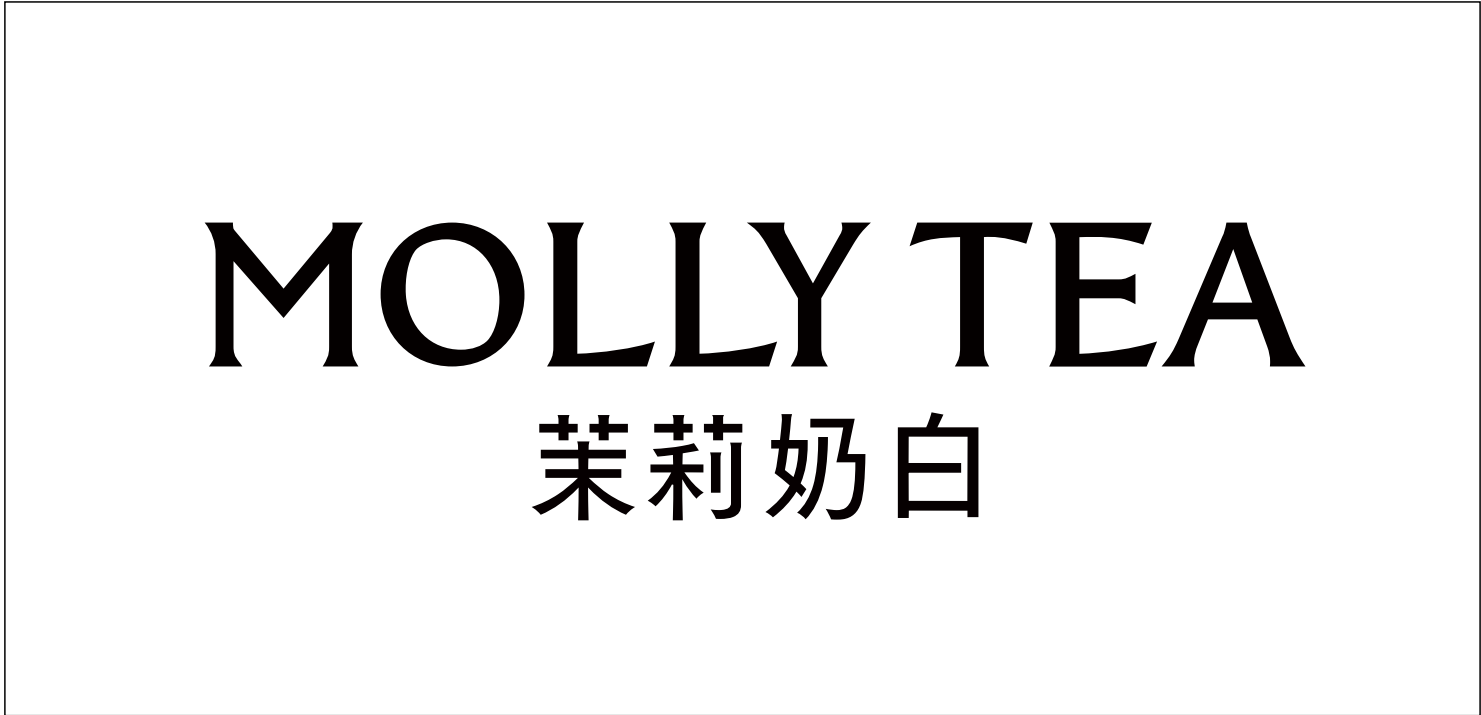
空间使用组合（海外 | 横）