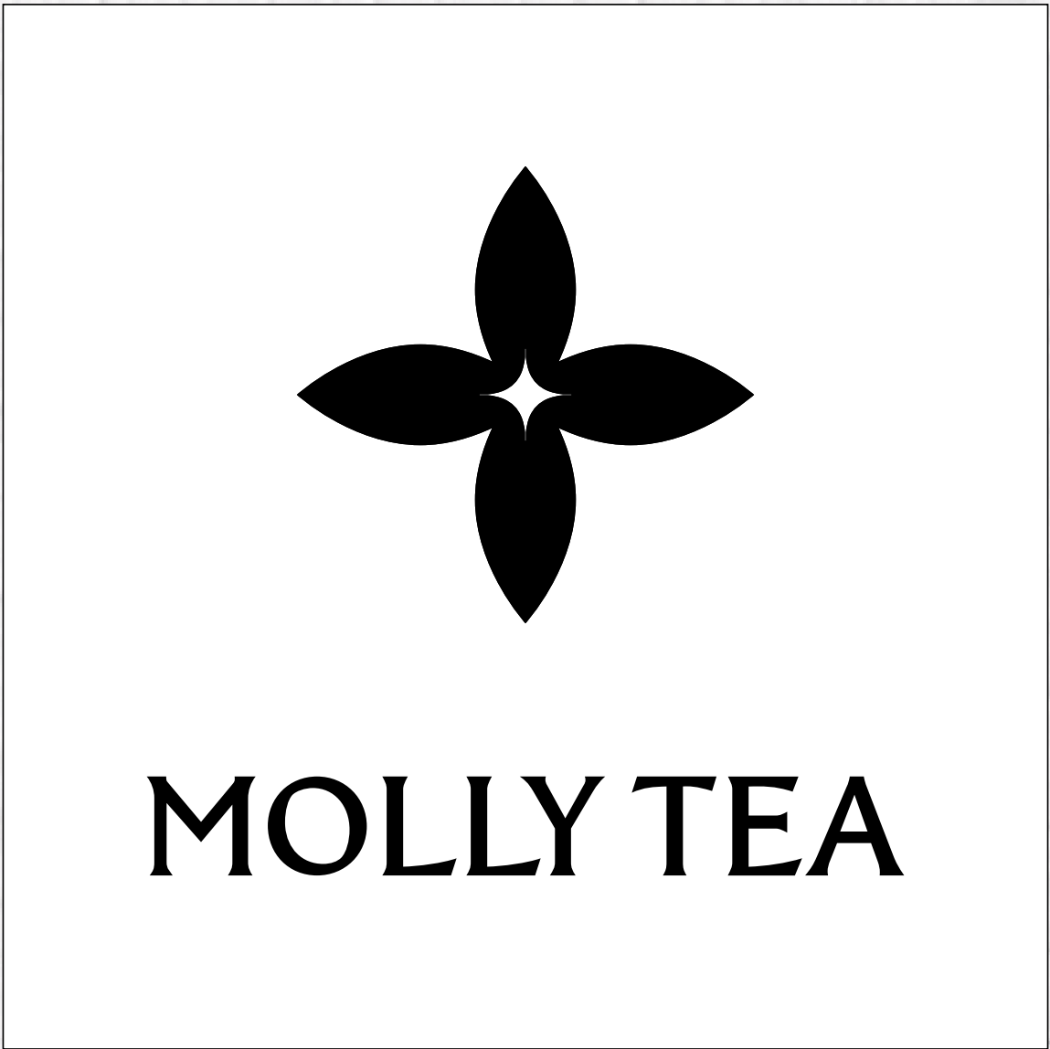
超级符号使用组合（纯英文版）